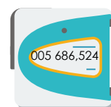
Misuratori elettronici, riportare:

i numeri grandi a sinistra della virgola