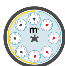
Misuratori meccanici, riportare:

i numeri neri i numeri neri i numeri indicati dalle lancette nere