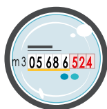
Misuratore con cifre Riportare i numeri neri